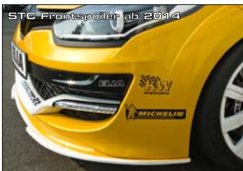
STC Frontspoiler ab 2014

Rundenrekord am Sachsenring für Renault- und französische Fahrzeuge durch AutoBild Sportscars (Juli 2015)