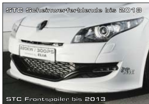
STC Scheinwerferblende bis 2013