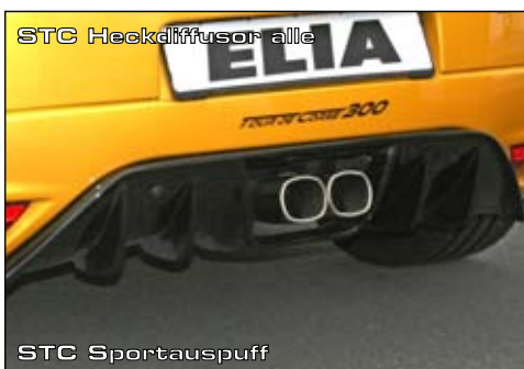
STC Heckdiffusor alle